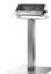
IS30-Ex with column